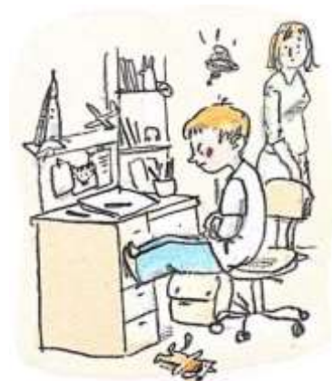
Vir: Nataša Konc Lorenzutti, Ana Zavadlav, Kakšno drevo zraste iz Mačka, Založba Miš, 2023

Katero dogajanje prikazuje ilustracija?, Kakšno razpoloženje izraža?, Kakšne so lahko posledice?, Se je tudi tebi že zgodilo kaj podobnega?, Opiši v povedih in pazi na pravilnost zapisa.